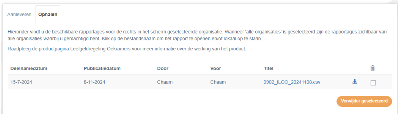
Figuur 6. Ophalen bestand

Let op: De rapporten worden op grond van de vastgestelde bewaartermijn na 3 maanden automatisch van het portaal verwijderd. Indien u ze langer wilt bewaren kunt u de rapporten lokaal opslaan.